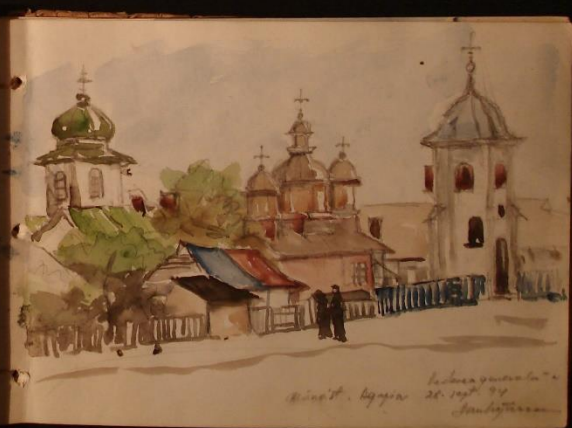
Lașcaș gârșoasă Mănăst. Arapia 20. sept. 94 Cornelia

ca în orice meserie mai ai momente, să nu tic de lăchărite dar îți mai vine să mai