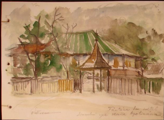
Fântâna în satul Sărbuți pe mare Apolonia