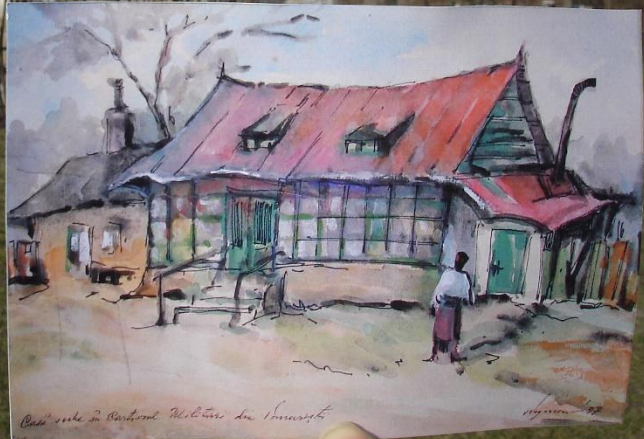
Casa unde în copilărie mă bucuram să dormesc